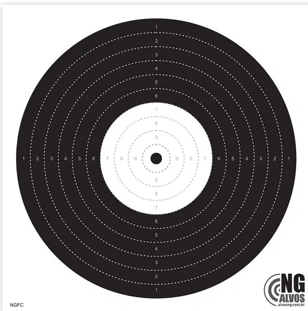
Alvo fogo central precisão – PF

Link: https://alvosng.com.br/produto/policia-federal/alvo-fogo-central-precisao/